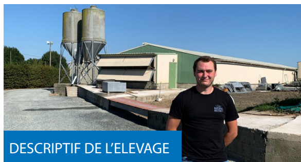
DESSCRIPTIF DE L'ELEVAGE