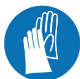
Gants nitrile EN 374 (à changer tous les 5 ans ou des l'apparition de signes d'usures)