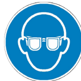
Lunettes de protection