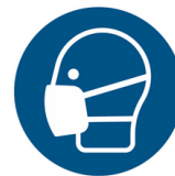
Masque de protection