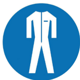
Combinaison chimique type 4 à usage unique.